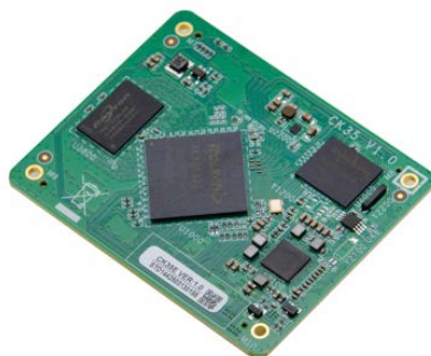
CK35 VER:1.0 主板侧面图