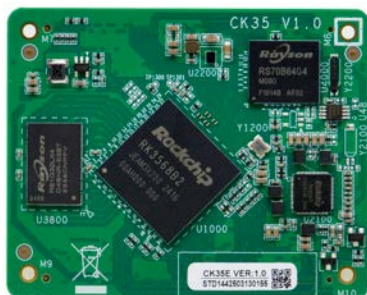
CK35 VER:1.0 主板正面图