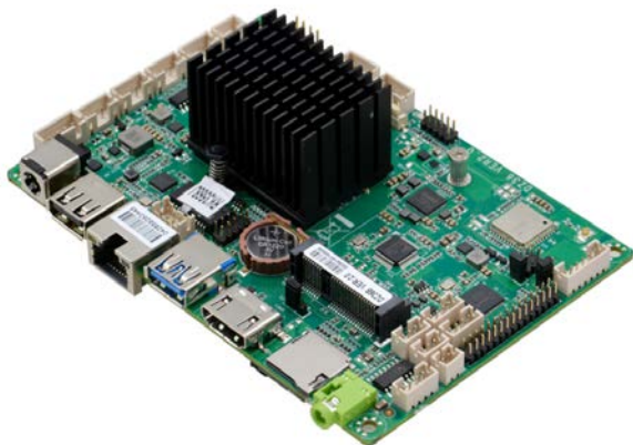
DZ36B VER2.0 (RK3568J) 效果图