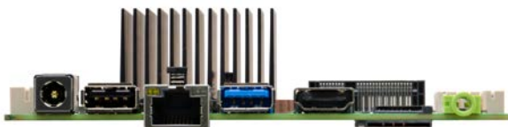
DZ36B VER2.0 (RK3568J)接口图