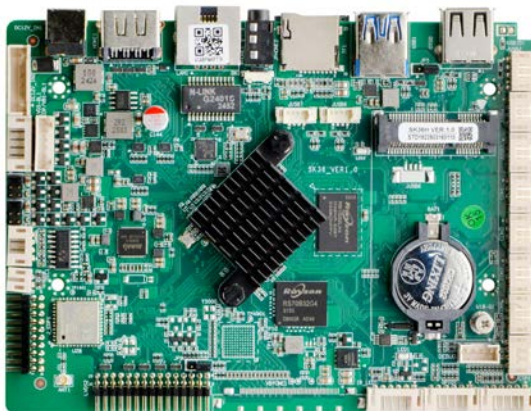
SK36H VER1.0 正面图