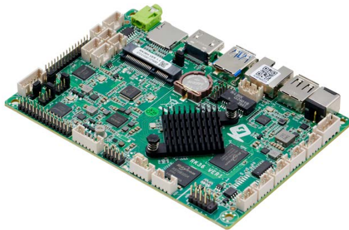
RK36 VER1.1 效果图