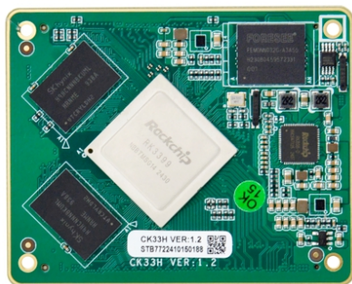
CK33H VER:1.2 主板正面图