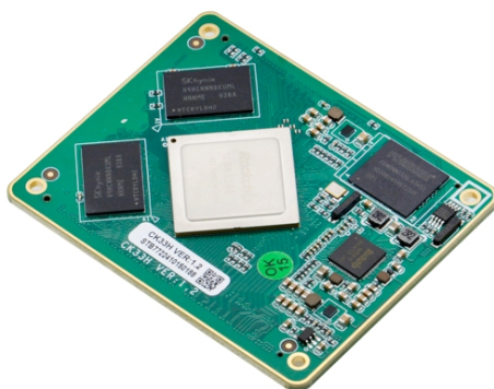
CK33H VER:1.2 主板侧面图